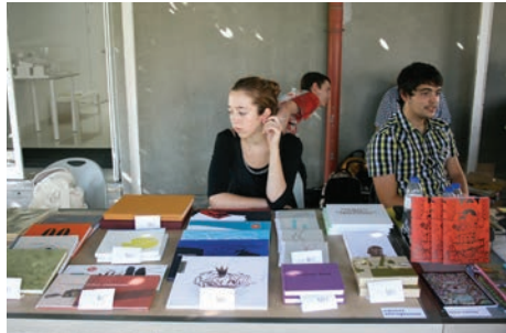
▼ Books Make Friends Feira de Publicação Independente