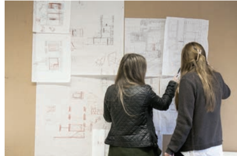
▼ Projeto Design de Interiores