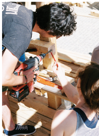
▼ Workshop Autoconstrução Arena Selfmade Design de Interiores