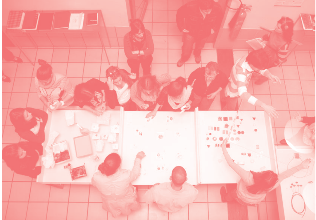
▼ Exposição de Joalharia Seminário do Espaço