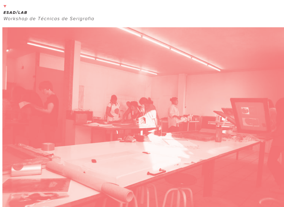
▼ ESAD/LAB Workshop de Técnicas de Serigrafia