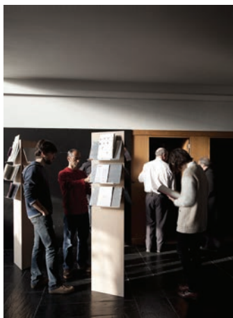
▼ Reader Design de Comunicação