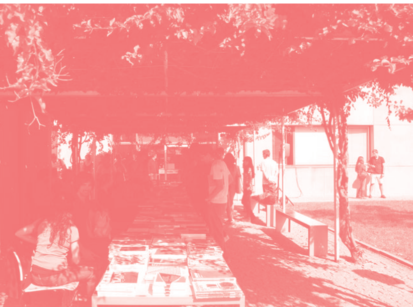
▼ Books Make Friends Feira de Publicação Independente