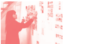
▼ Workshop Research Methodologies Design de Comunicação