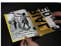
▼ No Limite Pedro Mato, Design de Comunicação