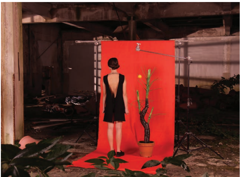
▼ Making of Video Fábrica de Santa Thyrsa Design de Moda/Artes Digitais e Multimédia