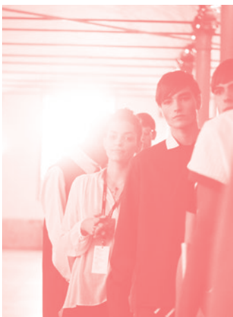
▼ Bloom/Portugal Fashion Finalistas Design de Moda