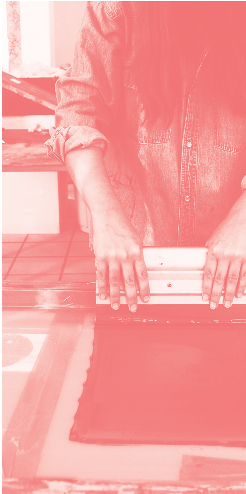
▼ ESAD/LAB Workshop de Serigrafia Experimental