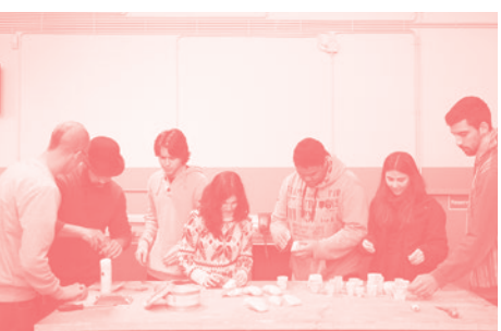
▼ Prototipagem Rápida Design de Produto