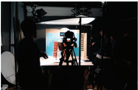
▼ Workshop Motion Design Lucas Zanotto Artes Digitais e Multimédia