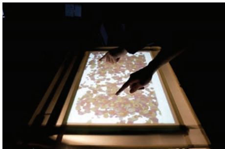
▼ Reactable Artes Digitais e Multimédia