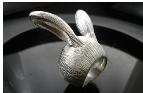
▼ Prémio Vite Joias Aurea Praga, Joalharia