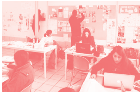
▼ Projeto Design de Comunicação