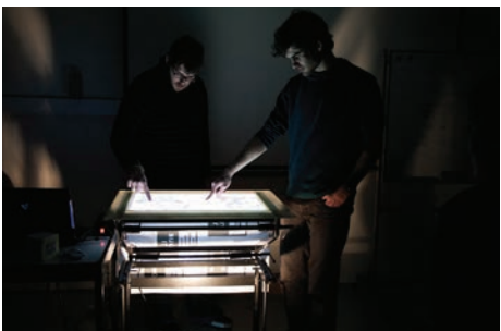
▼ Reactable Artes Digitais e Multimédia