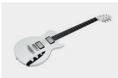
▼ Guitarra em Fibra de Carbono Eduardo Rocha Gonçalves, AVA Guitars