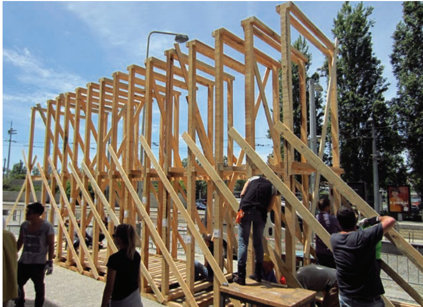
▼ Workshop Autoconstrução Viewport Winebar Design de Interiores